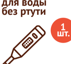
Термометр для воды без ртути