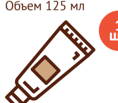
Крем от опрелостей Объем 125 мл