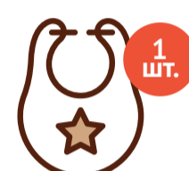
Слюнявчик с завязками