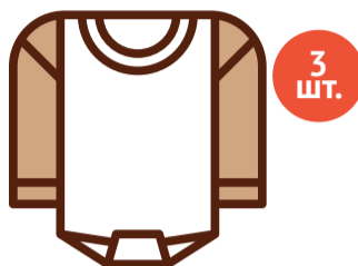
Боди с длинными рукавами