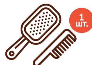
Набор «Расческа + щетка»