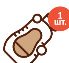
Шампунь для младенцев