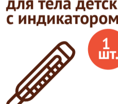
Термометр для тела детский с индикатором