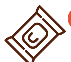
Влажные салфетки детские