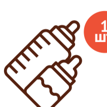
Бутылочка Объем 125-150 мл